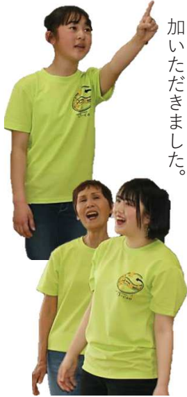
小郡ミュージックカンパニーO-canによるステージ

講演後の小郡ミュージックカンパニーO-canによるミニコンサートでは、一緒に歌ったり体を動かしたりと会場が一体となりました。また、7つの体験型イベントも前回に引き続き好評で、多くの方にご参加いただきました。