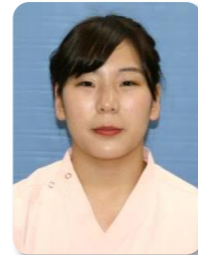
1. あべ のぞみ 2. 安部 希望 3. 5階東病棟 3. ハンドメイド、手芸