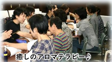
癒しのアロマセラピー♪