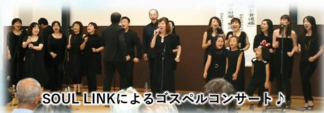
SOUL LINKによるゴスペルコンサート♪