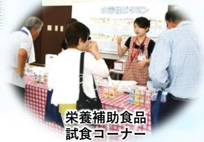
栄養補助食品 試食コーナー