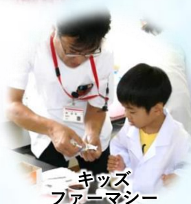
キッズ ファーマシー