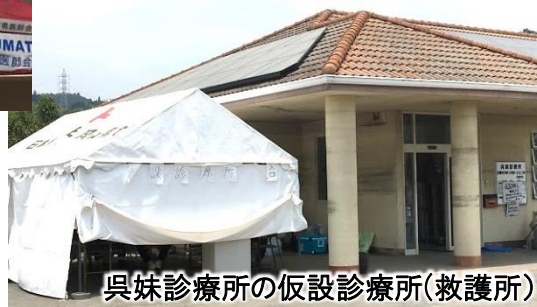
呉妹診療所の仮設診療所(救護所)

救護所の立地環境は、診療所脇の敷地内駐車場に設置された簡易テントでの診療であり、炎天下、また、幹線道路沿いでもあるため常時砂埃が舞い、散水車が通るものの数分で乾いてしまうという厳しい状況でした。(7月21日には空調のついたプレハブが設置されたとのことでした。)