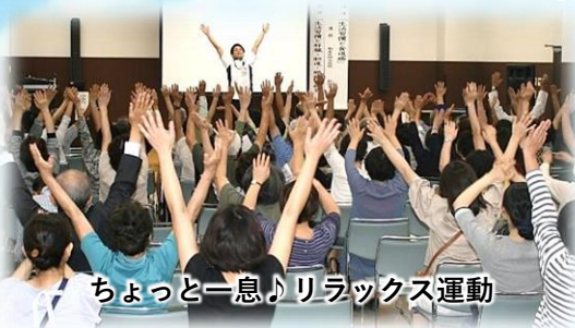
ちょっと一息♪リラックス運動